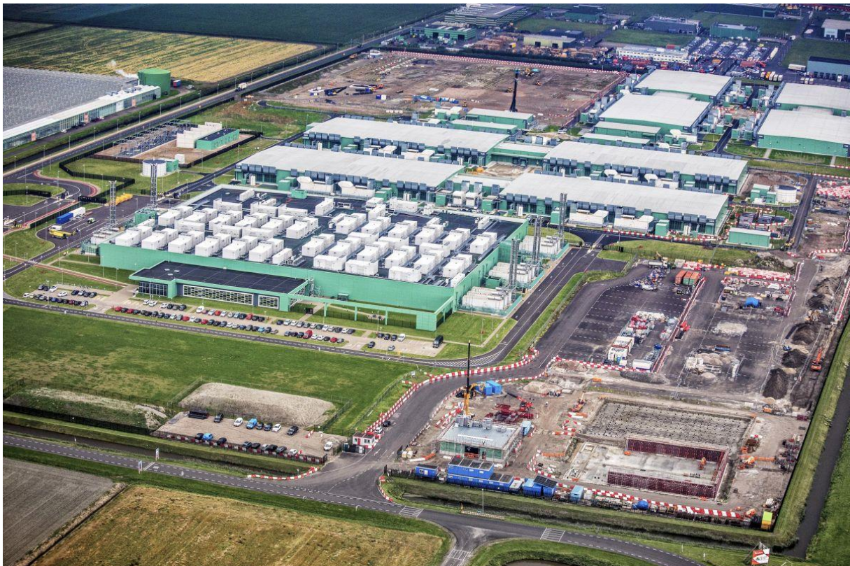
Datacentrum Microsoft Middenmeer kop van Noord-Holland.

De restwarmte van datacentra kan worden benut voor woningverwarming. Maar voor welke woningen? Initiatiefnemers in Oosterwold zijn al van het gas af en zelf in hun energiebehoefte voorzien. Het dichtstbijzijnde warmtenet ligt kilometers verderop aan de andere kant van de snelweg in Almere Stad.